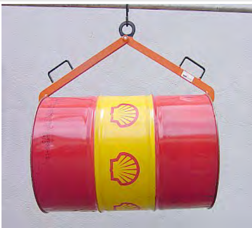
NSH - NSHG 500/900 Horizontální bez pojistky, s pojistkou