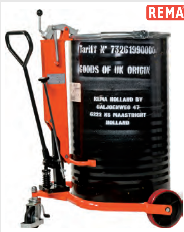
DH 250 kg Vozík pro zvedání a vyklápění sudů

Nosič sudů univerzální NSU Q/D je určen pro závěsnou manipulaci se sudy, případně plastovými nádobami o max. hmotnosti 500 kg při jmenovitém průměru sudu 600 mm.