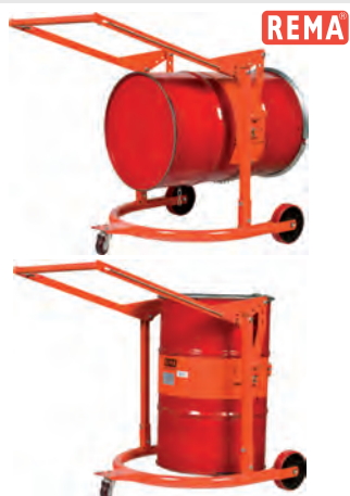
DM 365 kg Vozík pro zvedání a vyklápění sudů