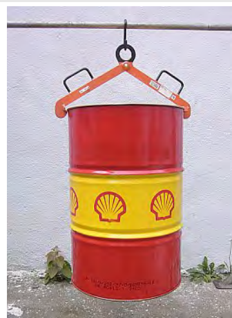
NSV 500 kg/600 mm Vertikální bez pojistky