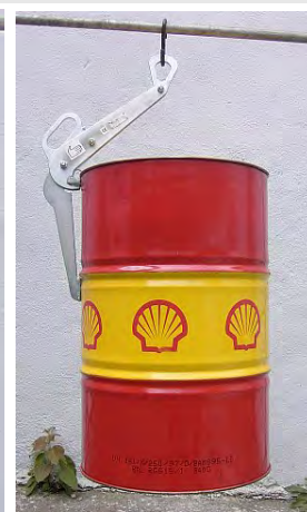
NSO 300/600 Okrajový