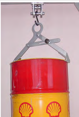
NSVG 300 kg/600 mm Vertikální s pojistkou