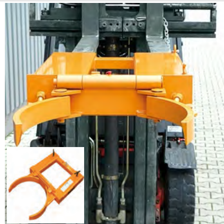
DTS 10/680 kg Nosiče sudů pro vysokozdvizné vozíky